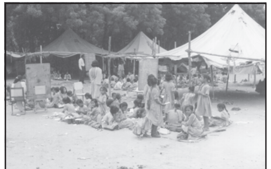
चित्रों की विवेचना करें (दो प्रकार के स्कूल)