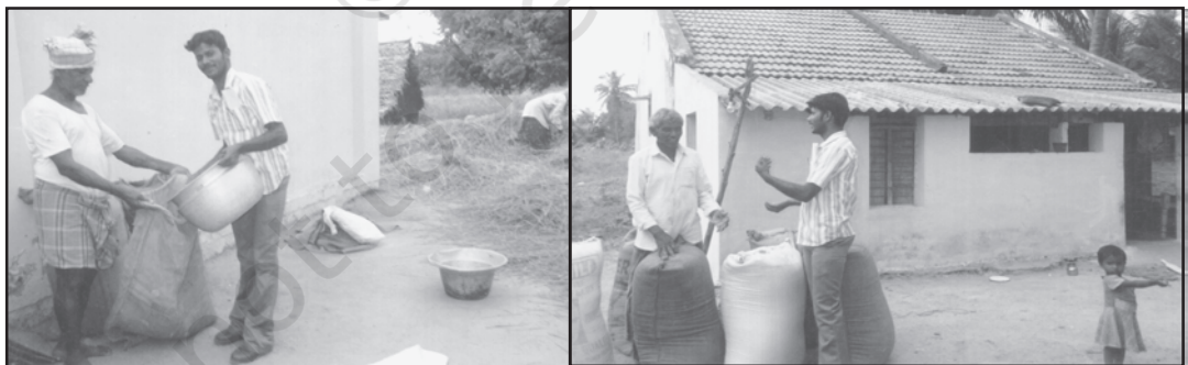
गाँव में धान की कटाई