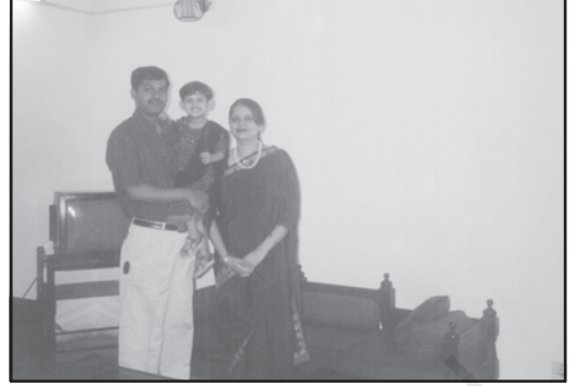
परिवारों और आवासों में अंतर पर ध्यान दीजिए